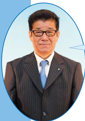
大阪市長 松井一郎