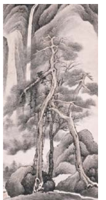
顧大申 《老松飛瀑図》(部分) 清時代・康熙3年(1664) 大阪市立美術館蔵(阿部コレクション)

中国では自然と人の生は常に連関して捉えられ、絵画の中にも表現されてきました。繁栄の象徴とされる松など自然を描いた作品を通して、先人の美意識や人生観に触れてみましょう。