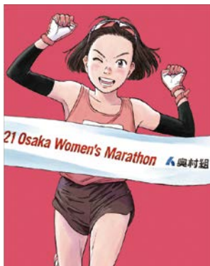
2021©浦沢直樹/N WOOD STUDIO

国内トップレベルの女性ランナーがヤンマースタジアム長居をスタート・フィニッシュとし、大阪城公園や御堂筋など市内を駆け抜けます。