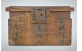
近江町会議所詰書物入(部分) 明治2年(1869年)頃 個人蔵

近代化で町が受けた変化を、運営のあり方や土地所有の実態などから明らかにします。 日 1/27(水)~3/1(月)9:30~17:00(入館は16:30まで)、火曜休館(火曜が祝日の場合は翌平日) ¥ 大人600円ほか 場 問 大阪歴史博物館 ☎6946-5728 FAX6946-2662