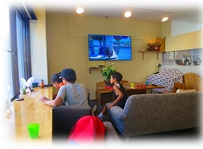
[おにぎりカフェけんちゃん]