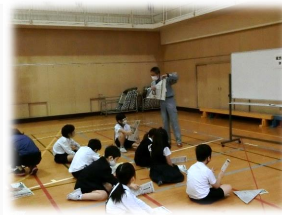
[紙食器づくり(生魂小学校)]

※小・中学生向けの動画教材を作成の上、区YouTubeチャンネルに掲載し、コロナ禍における防災教育の充実を図る