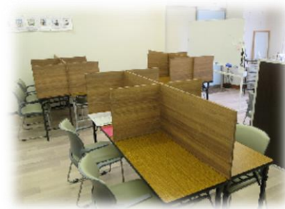
[みんなで学ぶ教室]