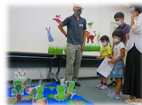
[動物園へ行こう&遠足] (5・6歳児とその保護者)

区内にある大阪国際交流センターや日本語教育センター等との連携を深め取組をすすめる