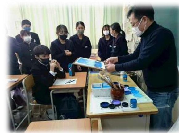
[職業講話の様子(夕陽丘中学校)]

職業講話・体験受入先の情報共有を積極的に行い、各校のニーズに応じたキャリア教育を支援する