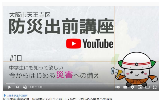
[中学生向け防災学習動画]