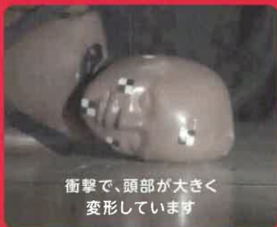
衝撃で、頭部が大きく 変形しています