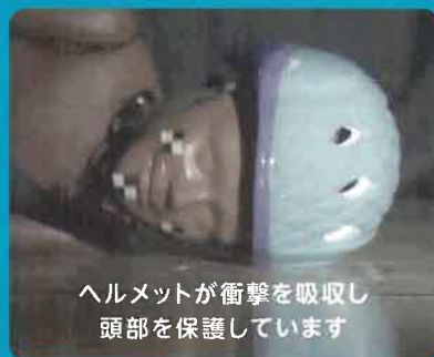
ヘルメットが衝撃を吸収し 頭部を保護しています