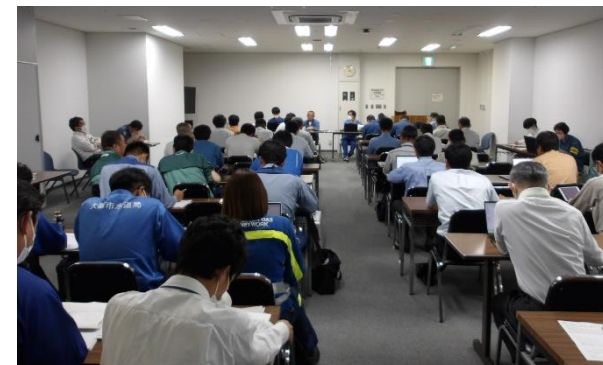
労働基準監督署等による安全点検・安全講習（令和5年6月）