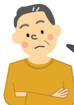
来庁者 (聴覚障がい者)