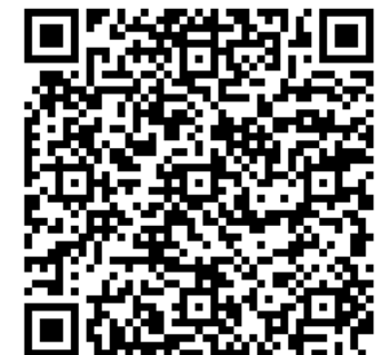
東成区HP (人権冊子データ版)