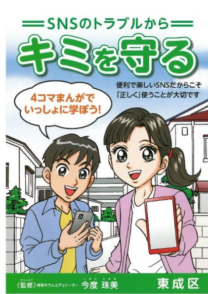
小学校高学年向け冊子 (R2年度作成)