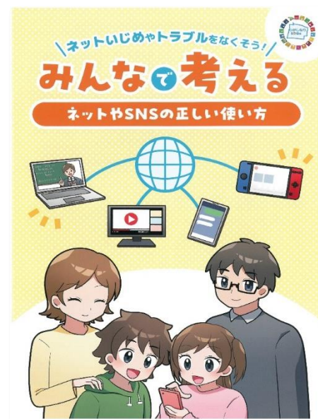
小学校低学年向け冊子 (R4年度作成)