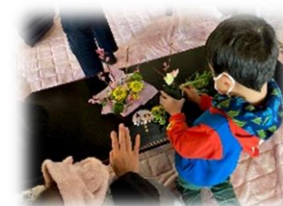
[ともいき子ども塾]