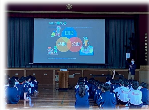
[防災学習(高津中学校)]

※小・中学生向けの動画教材を作成の上、区YouTubeチャンネルに掲載し、コロナ禍における防災教育の充実を図る