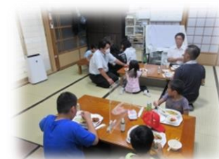
[聖和こども学習会]