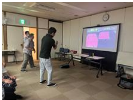
eスポーツ体験会の様子