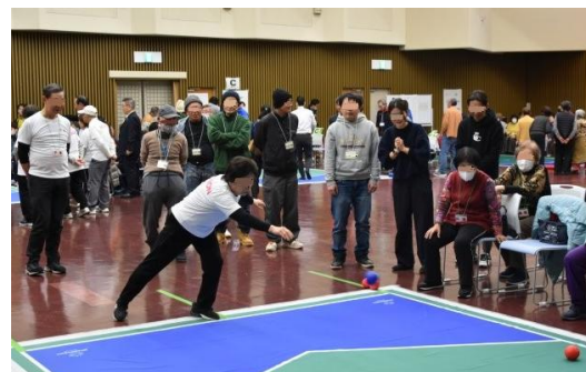
ボッチャ大会の様子