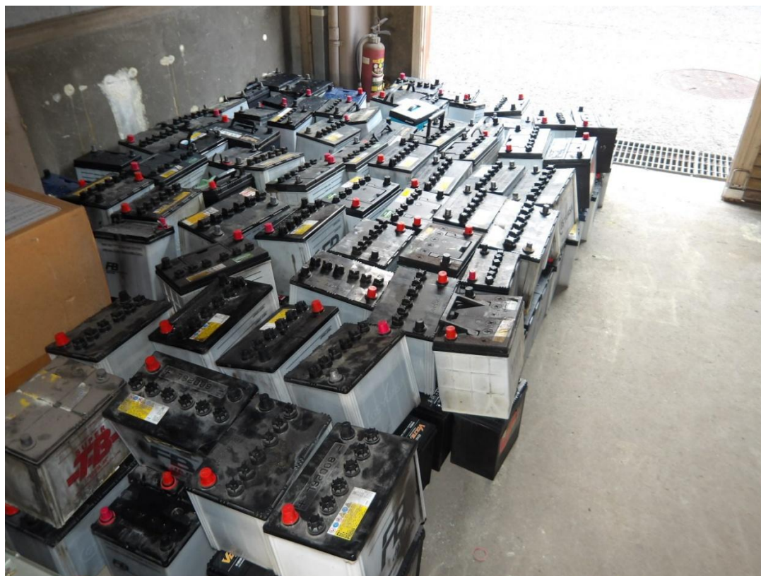
廃バッテリー（北側から）