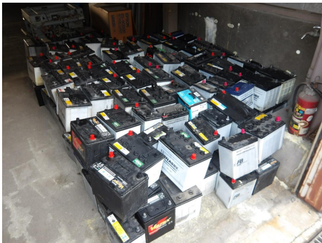
廃バッテリー（南側から）