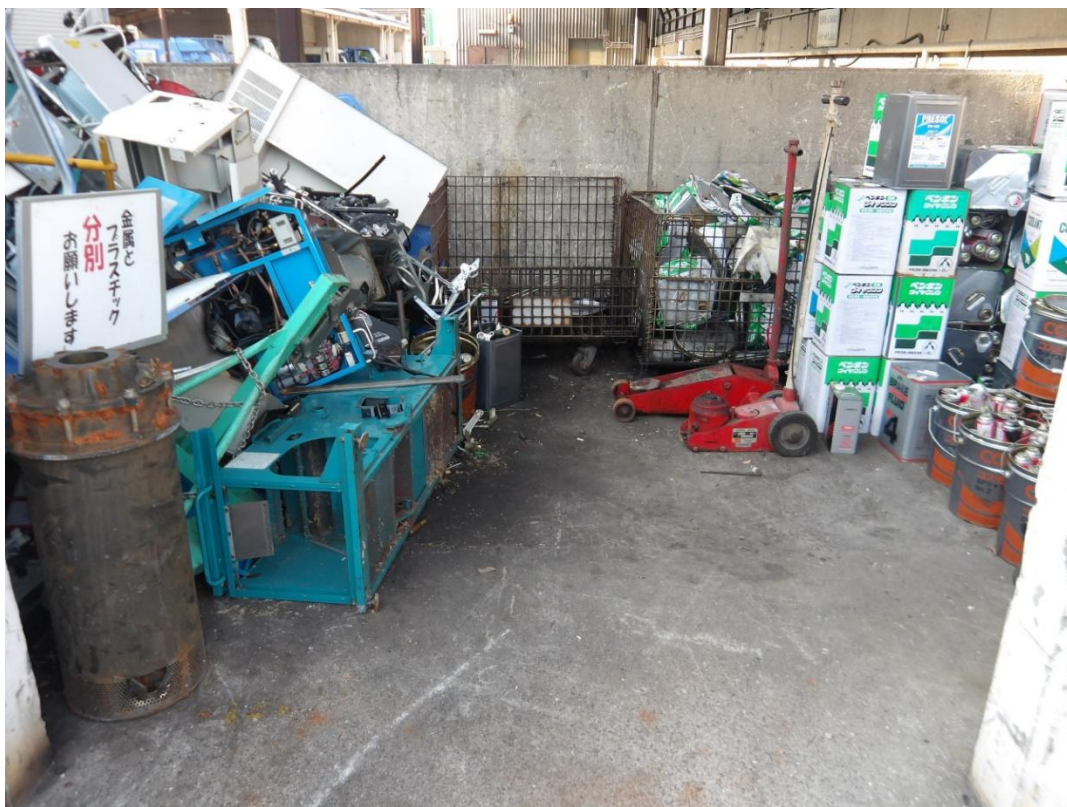
廃材（西から東方向）