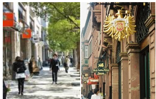
掲出方法にルールを持たせた、統一感のあるテナントのサインの例。