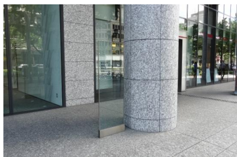
テナント名を集約して表示している例。