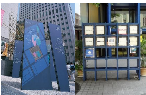
一目で用途や空間構成が分かるサインの例（左）。モニュメントのようなテナントサインの例（右）。