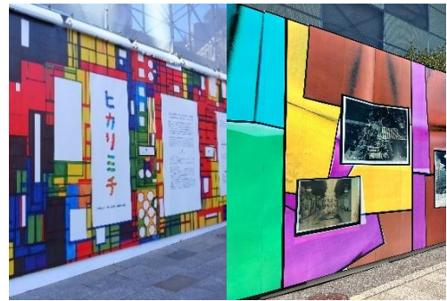
工事仮囲いに、デザイン性のある表示内容を掲出することで上質なにぎわいを演出した例。