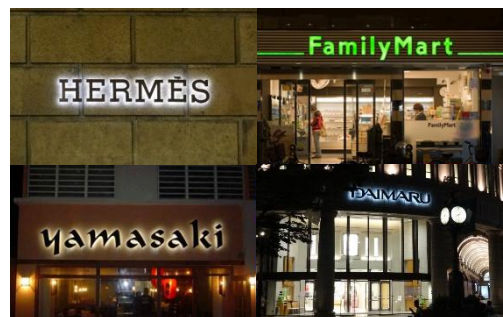
切り文字やバックライトを用いてデザインに配慮した、スマートで表情のあるサインの例。