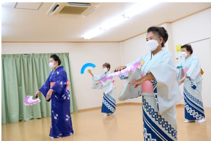
鯉江小学校 民舞踊

※過去3年間の区広報誌で掲載したものは次のとおりです。 (No. 334 (2024年3月号)、No. 317 (2022年10月号))