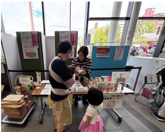
災害時の備蓄コーナー