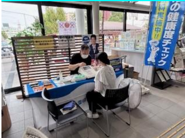
骨の健康度チェック