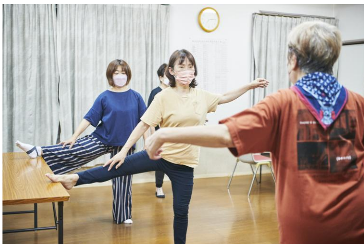
榎並小学校 ストレッチ健康体操