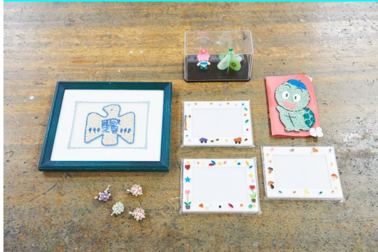
聖賢小学校 ペーパークイリング