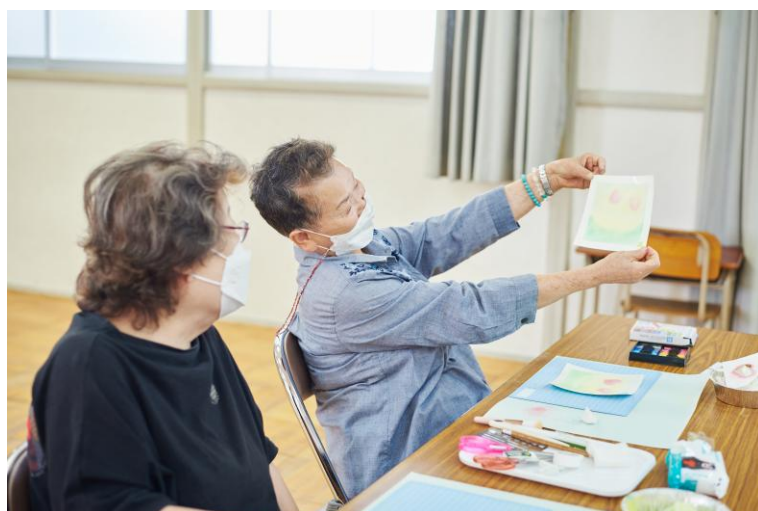
放出小学校 パステルアート