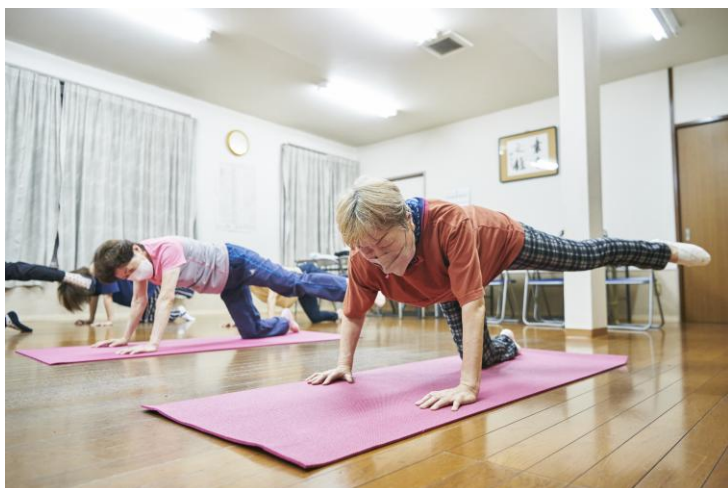
榎並小学校 ストレッチ健康体操