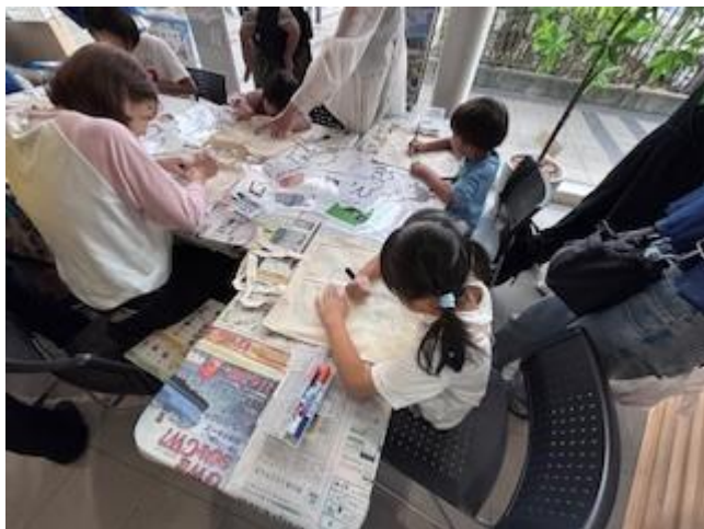
エコバッグづくり