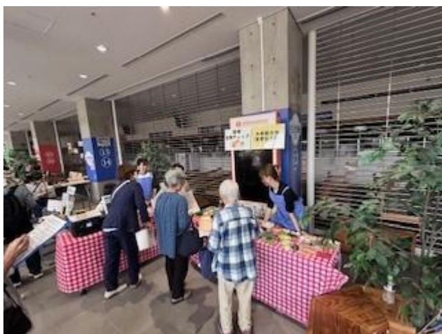
簡単食事チェック