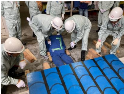
救出活動訓練の様子

【応募条件】 区内に在住または在勤の方で、地域防災リーダー の役割を十分理解し、意欲・体力を有する者（地域 災害対策本部長の推薦が必要です。）