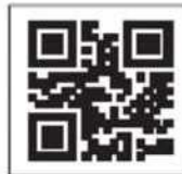
交付申請用QRコード