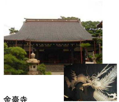
金臺寺 本堂天井の龍の彫り物

文明 8 (1476) 年安房国北条にて開創、慶長 11 年 (1606) 大阪安堂寺町に移転、明暦 2 (1656) 年当地に移転、平成の大修理を終えました。本堂天井には龍の彫り物 (左官塗り細工・鏝細工) があり一見の価値大です。本堂は明暦 2 (1656) 年 (江戸初期) に建てられた寺町で一番古い建造物で、鐘楼は江戸中期、山門は江戸後期の江戸時代の古い価値あるもの。本尊阿弥陀如来も大きな立派な仏様です。本堂は檜より高価な榿 (とが) 造りで榿普請は高級な普請の代名詞でした。大坂観音巡り第 28 番札所で韋駄天像は大阪市指定文化財に登録され、現在国立文化財修理所 (奈良) で修理予定。