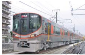
▲新型車両323系の外観

今年度中にデビュー予定の新型車両「323系」。「安全、安心の向上」「機器の信頼性向上(安定輸送)」「情報提供の充実」「人に優しい快適な車内空間」をコンセプトに開発された。大阪環状線で長年親しまれてきたオレンジ色が基調の先進的な車両デザイン。8両編成、片側3ドアで、各車両に車椅子・ベビーカースペースを設けるなど、バリアフリー対応を充実。女性専用車両は、LED照明に電球色を採用するなど、わかりやすくなっている。