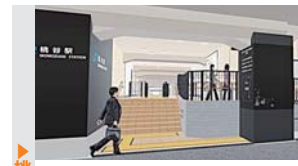
▲桃谷駅改築後のイメージ

平成8年に発売されて翌年異例のヒット、平成12年には12万枚を売り上げた。「鶴橋と言えば焼肉!」との鶴橋駅係員の発案でこの曲が採用されることになり、再発掘に雀三郎師匠ご本人が一番驚いておられるとか。