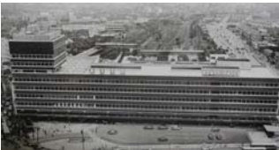
▲昭和39年9月木造駅舎に代わり鉄筋の新駅舎完成

JR西日本エリアで乗車人員が大阪駅、京都駅に次ぐ3位の天王寺駅。あまり知られてはいないが、天王寺駅の地下には駅開設時の掘削工事で湧き出した湧き水が今も流れ、それが駅東口のトイレの排水やホーム屋根の散水冷却に利用されている。そんな天王寺駅も耐震補強にともない、これから東口コンコースのリニューアル工事が行われる。周辺の発展と共に、交通の要所はさらに魅力的な駅に変わっていく。