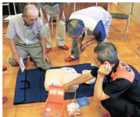
▲人形等を使用した分かりやすい講習