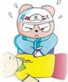
▲天王寺消防署 マスコットキャラクター「救太(きゅうた)くん」

大切な人の生命を助けるために、AEDの使用方法を含めた心肺蘇生法などの応急手当を学ぶ講習です。講習を修了された方には修了証を交付します。