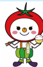
大阪市食育推進キャラクター「たべやん」

①天王寺動物園での食育クイズラリー。対象は小学生以下。日 6/9(土) 場 天王寺動物園 ②あべのハルカス近鉄本店での食生活診断。日 6/15(金) 場 あべのハルカス近鉄本店 問 健康局健康づくり課 ☎6208-9961 FAX6202-6967