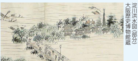
淀川洪水図(部分) 大阪歴史博物館蔵

日 6/25(月)まで9:30~17:00(入館は16:30まで)火曜休館 場 問 大阪歴史博物館 ☎6946-5728 FAX6946-2662