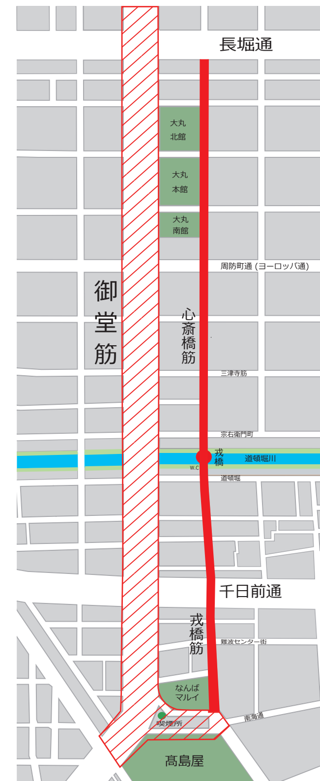
凡 例 既設禁止区域(御堂筋) 新設禁止区域(心齋橋筋～戎橋筋)