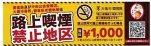
③外国人向け啓発記事掲載