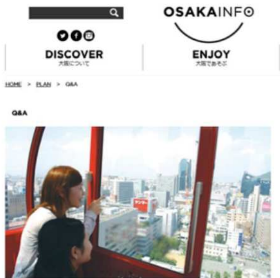
大阪について、よくある質問をまとめました。