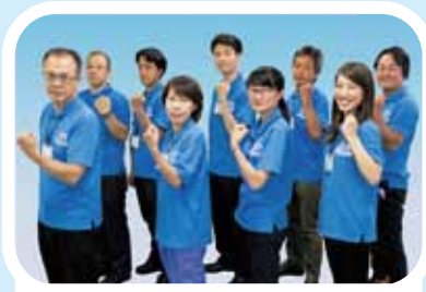
あなたの声をつなげ隊