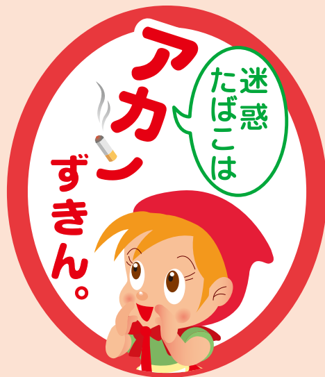
▲大阪市路上喫煙防止キャラクター アカンずきん

大阪市では、「大阪市路上喫煙の防止に関する条例」により、大阪を代表するような人通りの多いターミナル周辺エリアを中心に路上喫煙禁止地区を指定しています。