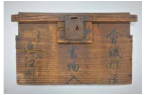
近江町会議所詰書物入(部分) 明治2年(1869年)頃 個人蔵

☑ 1/27(水)~3/1(月)9:30~17:00(入館は16:30まで)、火曜休館(火曜が祝日の場合は翌平日)