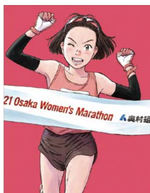
2021©浦沢直樹/N WOOD STUDIO

国内トップレベルの女性ランナーがヤンマースタジアム長居をスタート・フィニッシュとし、大阪城公園や御堂筋など市内を駆け抜けます。