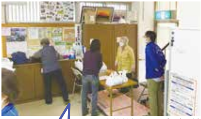
▲高齢者食事サービス(配食)