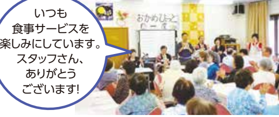
▲高齢者食事サービス

いつも 食事サービスを 楽しみにしています。 スタッフさん、 ありがとうございます!