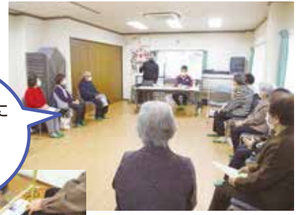
▲福祉健康研修会(骨密度の測定など)