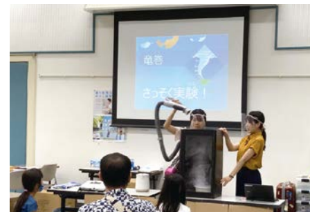
気象キャスターによる竜巻実験

幼児～小学生を対象に、水に関するワークショップや体験型のイベント、謎解きなどを開催。定員各回40人(事前予約制)。