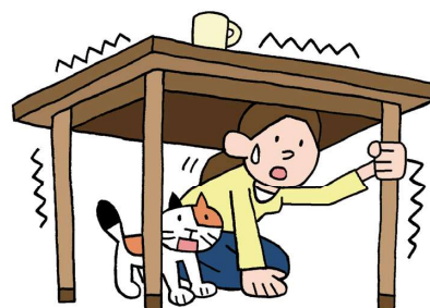
家具類の転倒・落下・移動を防ぐ 11頁

緊急地震速報が鳴れば、すぐに家具類の転倒・落下の恐れがない安全な場所に移動するか、落下物などから身を守るために、丈夫なテーブルなどの下で揺れが収まるのを待ちましょう。