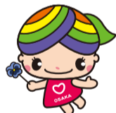
大阪人権啓発 マスコットキャラクター 「にっこりな」

地域には病気や障がい、介護、子育てなど配慮や支援などが必要な方がいます。過剰な詮索や本人の承諾を得ずに第三者に情報を伝えることは人権侵害につながります。年度替わりを迎え地域の顔ぶれが替わるなか、一人ひとりが地域で快適に暮らせるよう、お互いのプライバシーを尊重しましょう。人権啓発・相談センターでは、専門相談員が人権に関するさまざまな相談をお受けしています(無料・秘密厳守)。☎6532-7830(なやみゼロ)・FAX6531-0666・✉でご相談ください。