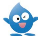
水道局 イメージキャラクター 「びゅあら」

転出入者が多い3月・4月は、日曜・祝日も水道の使用開始・中止等の各種届出、漏水の連絡などを受け付けます(月~金は8:00~20:00、土日祝は9:00~17:00)。また、各種届出はHPからも申し込みます。