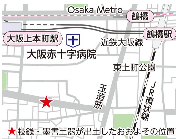
★ 枝銭・墨書土器が出土したおおよその位置

先人が築いた文化に触れ、長い道のりに想いをはせることで、現在、未来を考えるヒントが見つかるかも知れません。天王寺区役所1階の展示コーナーでも出土品がご覧いただけますので、ぜひ、この身近にある豊かな歴史遺産との出会いをお楽しみください。