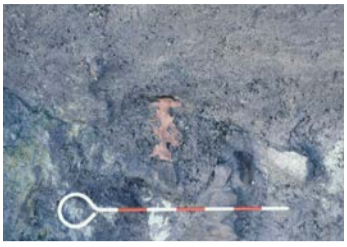
出土したばかりの枝銭

調査現場は幹線道路の建設予定地でした。小さな試掘調査を行った結果、古代の遺物を含む地層が確認され、約2000平米の本格的な調査を行うことになりました。中世の地層までは畑の跡が見られるくらいだったので、古代の地層に至ってから多くの遺物が出土するようになり、状況が一変しました。