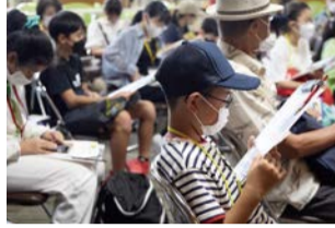
展示作品や資料などの破損を防ぐための説明を聞く会員たち

大阪市立美術館は大規模改修工事のため休館中です。なお、リニューアルオープンは、令和7年(2025年)春ごろの予定です。