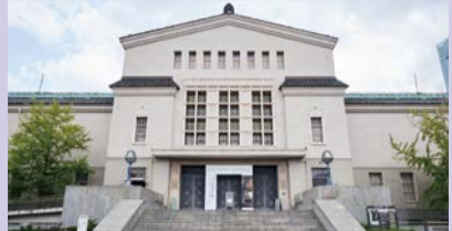
80年以上の歴史を持つ大阪市立美術館

大阪市立美術館は大規模改修工事のため休館中です。なお、リニューアルオープンは、令和7年(2025年)春ごろの予定です。