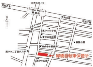
緑橋自転車保管所(東成区東中本3-8-33)

4月1日(土)から寺田町駅・桃谷駅で撤去した自転車は、緑橋自転車保管所で保管・返還します。 4月1日(土)以降の返還場所