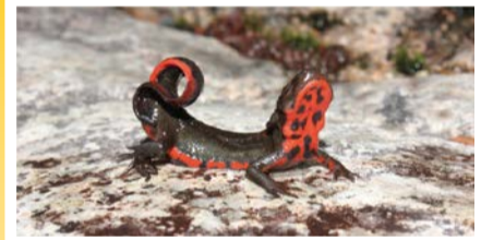
アカハライモリ

動物や植物、菌類、鉱物、人工毒など自然界に存在する毒について、動物学、植物学、地学、人類学、理工学の各研究分野のスペシャリストが解説します。