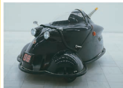
ヤノベケンジ「アトムカー(黒)」1998年 国立国際美術館蔵 ©Copyright KENJI YANOBE

大阪中之島美術館の活動の両輪であるアートとデザインを並行的に紹介する展覧会。およそ100点におよぶ戦後日本の多彩な作品を時とともに追いながら、デ