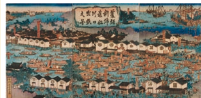
菱垣新綿番船川口出帆之図(大阪城天守閣蔵)

徳川幕府のもとで息を吹き返して経済の中心地となり、幕末政治の舞台ともなった大坂の歩みをたどります。