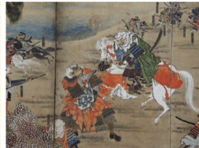
川中島合戦図屏風(大阪城天守閣蔵)

絵画や文字資料などさまざまな形をとり、虚実織り交ぜたストーリーとして現代にまで伝えられた戦国時代の名高い合戦や歴史的な重大事件に迫ります。