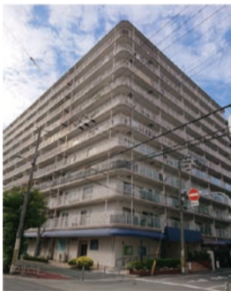
第35回ハウジングデザイン賞特別賞受賞住宅

魅力ある良質な集合住宅を表彰する「大阪市ハウジングデザイン賞」を実施。推薦いただいた方の中から抽選で50人に図書カード(500円分)をプレゼント。