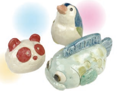
陶器の貯金箱作品イメージ

吹きガラス・陶芸・染色・織物・木工・金工など10種類の本格的な工芸体験ができる体験教室。定員4～30人(先着順)。各教室の対象年齢や費用など、詳しくはHPをご覧ください。