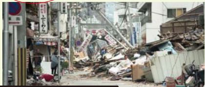
阪神淡路大震災では