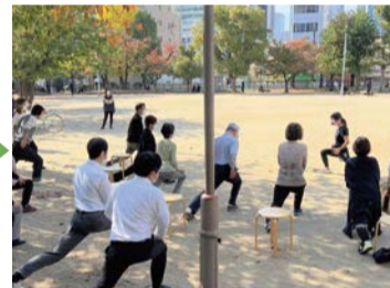
お昼休み☆20分ゆるゆるストレッチ