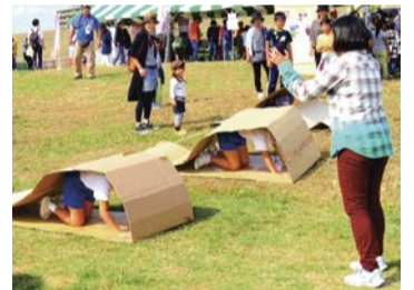
ダンボールキャタピラー

問い合わせ▶建設局調整課 ☎06-6615-6704 FAX06-6615-6070