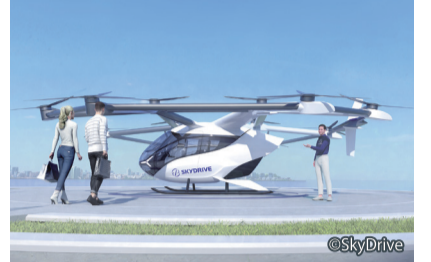
空飛ぶクルマの機体イメージ