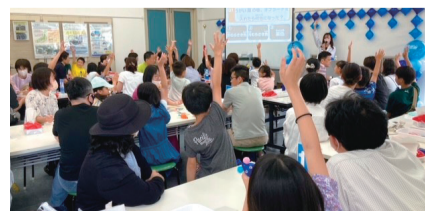
クイズ大会の様子