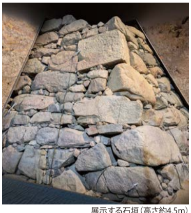
展示する石垣(高さ約4.5m)

太閤なにわの夢基金を活用し整備していた豊臣石垣館が、いよいよ開館します。1615年の大坂夏の陣で豊臣方が敗れて以来、400年以上地中に眠り続けていた初代大坂城の石垣を直接見ることができます。天守閣の豊臣期、徳川期の展示とあわせて、ぜひ大阪城の魅力を体感してください。 日 9:00～18:00(入館は17:30まで) 料 大人1,200円ほか ※天守閣入館料も含む 問 経済戦略局観光課 ☎06-6469-5164 FAX06-6469-3896