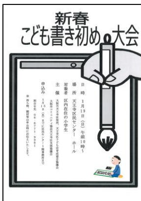
③ こどもカーニバル (新春書初め大会・子ども大会・子ども運動会)