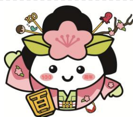
ももてんちゃん 100周年 バージョン