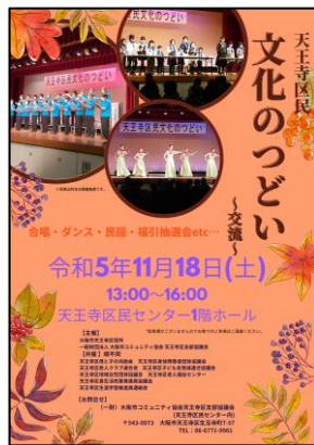
②-1 区民文化のつどい