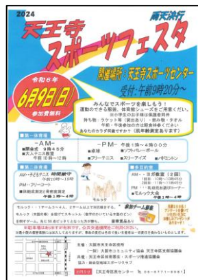
④ スポーツフェスタ