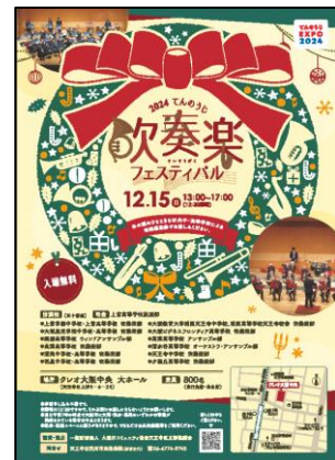
【てんのうじ吹奏楽フェスティバル】 区内中学・高校が集まる演奏会

問7（生涯学習）天王寺区では、小学校の教室を活用して「生涯学習ルーム」を実施するなど、市民一人ひとりの自己実現や生きがいづくりに向けた「生涯学習活動」を推進しています。あなたは「生涯学習ルーム」や、その他「生涯学習活動」に参加したいと思いますか。 当てはまる番号をひとつだけ選び、○を付けてください。