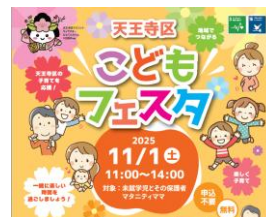
親子参加型イベント（こどもフェスタ）