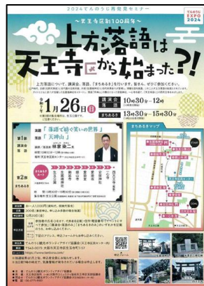
【講演会・まちあるき】 上方落語をテーマに開催