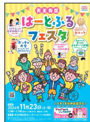
⑤ はーとふるフェスタ