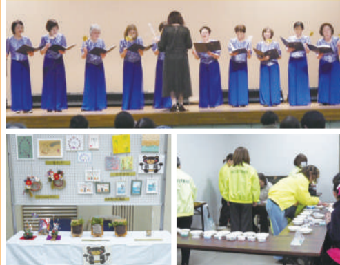
第20回天王寺区生涯学習ルーム発表会(2/8)のようす

興味のある方は下記連絡先までお問い合わせください。各校の担当者からご連絡します。