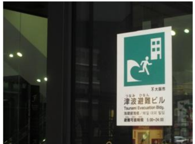
B3F に備蓄倉庫を有する津波避難ビル