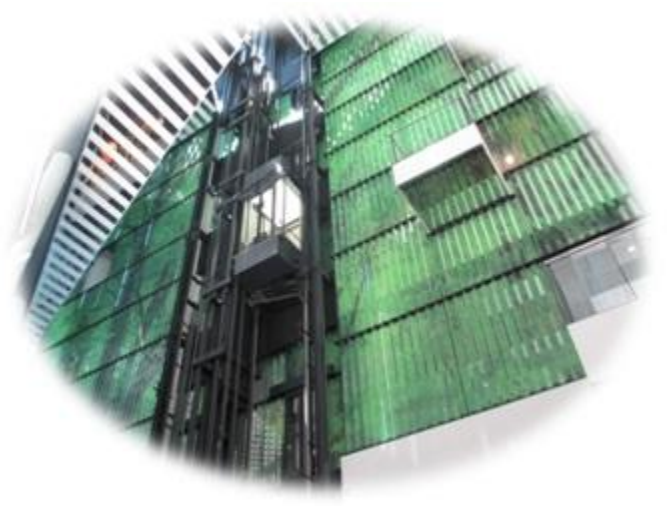
フコク生命の森 吹き抜け