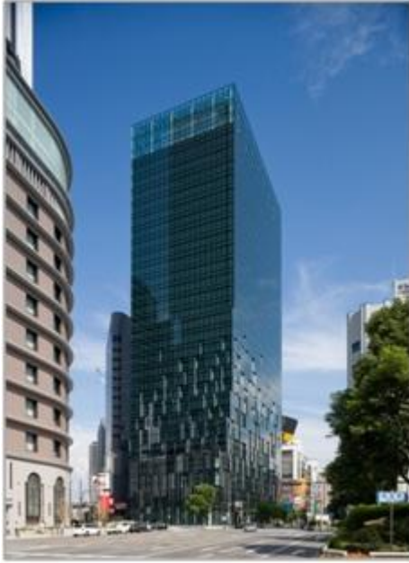
大阪富国生命ビル 外観