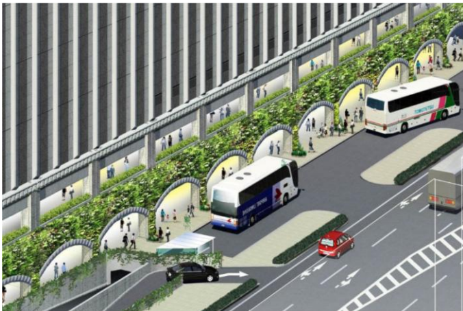
観光バス発着スペース・壁面緑化 1F