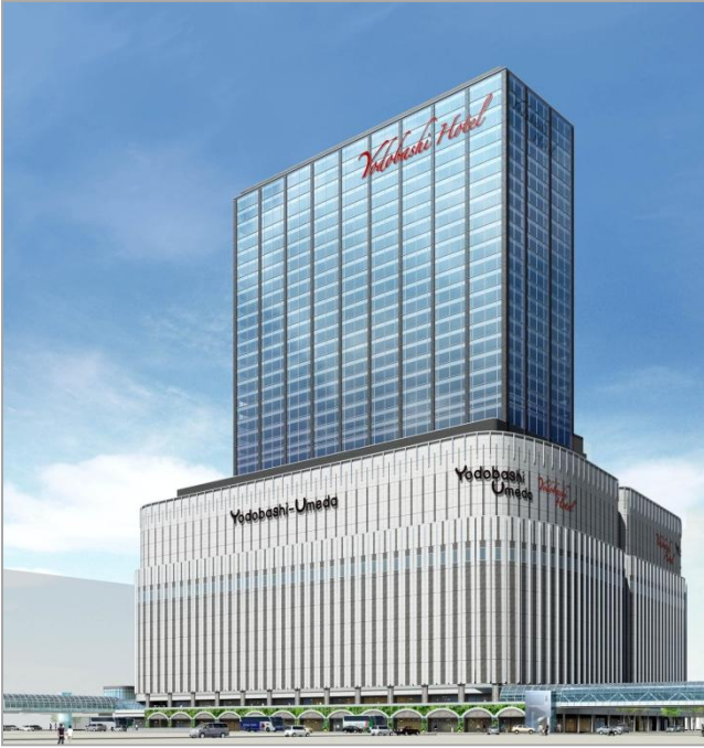
ヨドバシ梅田 2期開発 外観