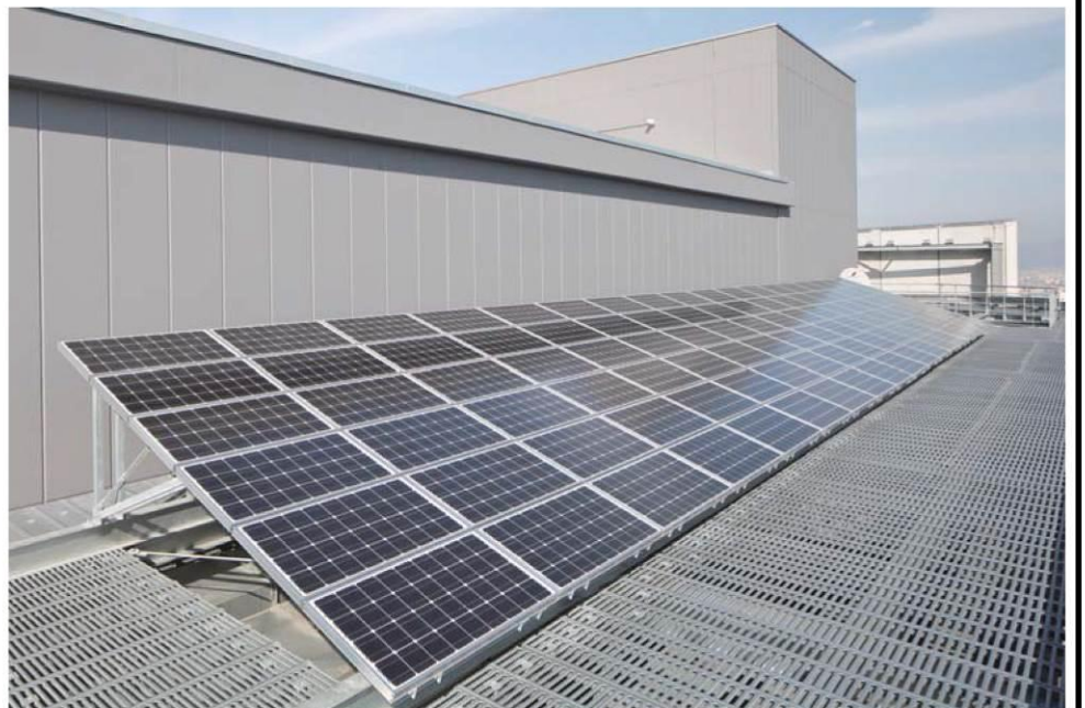
屋上に設置した10kWの太陽光発電パネル