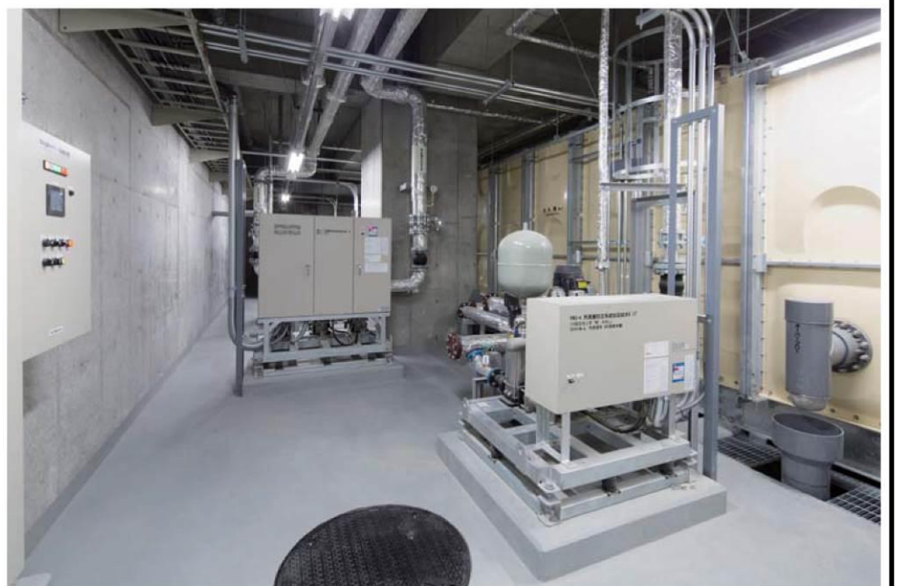
災害時に利用可能な地下の受水槽