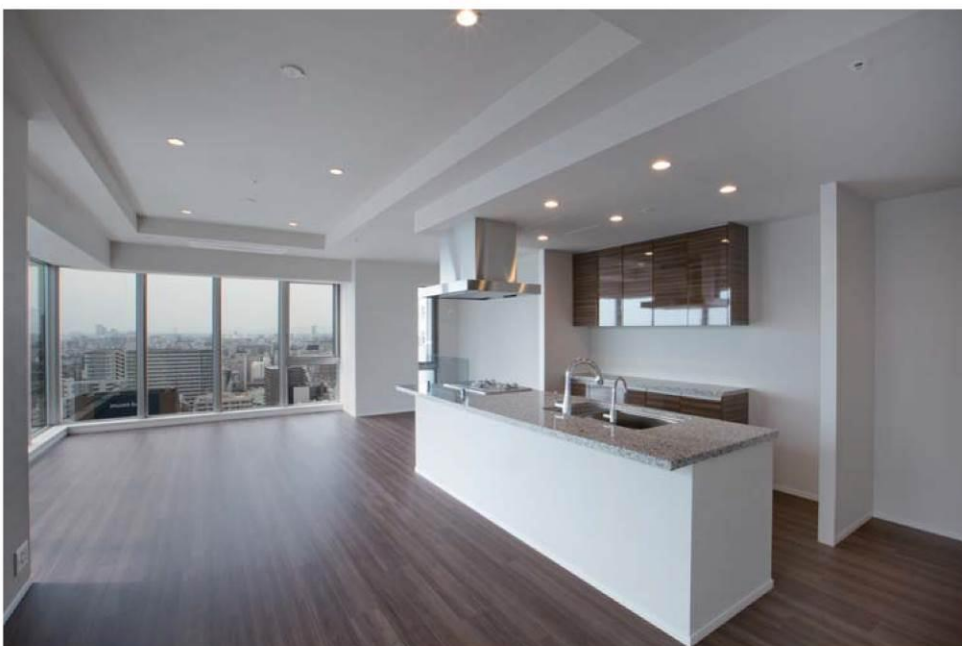
標準的なリビングの天井高さは2.7mを確保