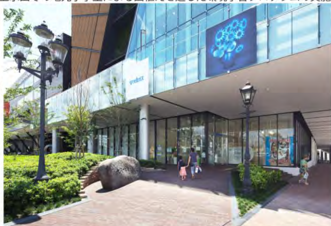
【1階エントランスに設置した大阪ガス発祥の記念碑とガス灯】