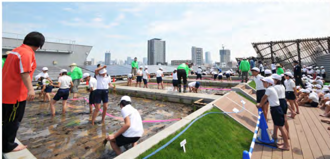
【屋上水田での地元小学生による田植えを通じた環境学習プログラムの実施】