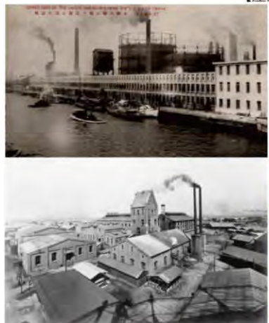
【1905年当時の岩崎工場の風景】