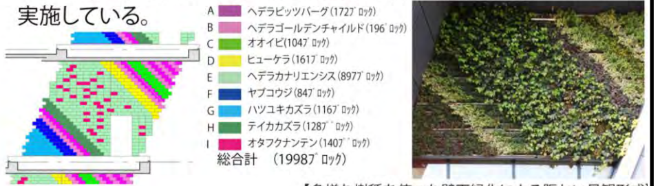
【多様な樹種を使った壁面緑化による賑わい景観形成】

建築面では外壁と金属パネルの間に空気層を形成し、室内環境を向上させる「ウォールダクト」の採用や、再生木材を利用したルーバー、壁面緑化等による意匠性と環境性を兼ね備えた統合デザインを実施している。