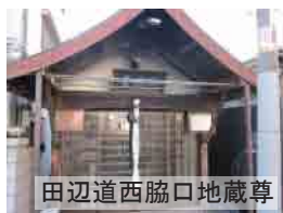
田辺道西脇口地蔵尊