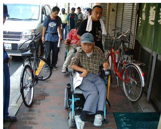
商店街を点検（Bコース）