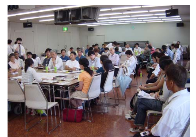
ワークショップのようす