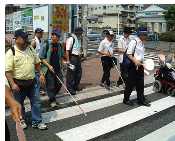
横断歩道を点検（Bコース）