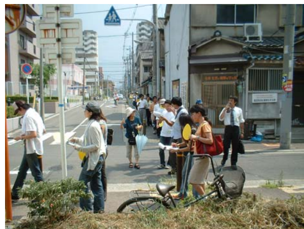
歩道を点検（Aコース）