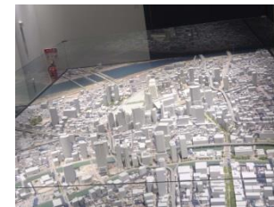
【グランフロント大阪 大阪駅周辺地域模型】