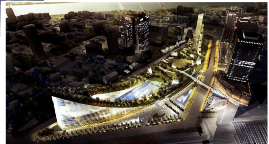
（JR 大阪駅方向からの眺望）