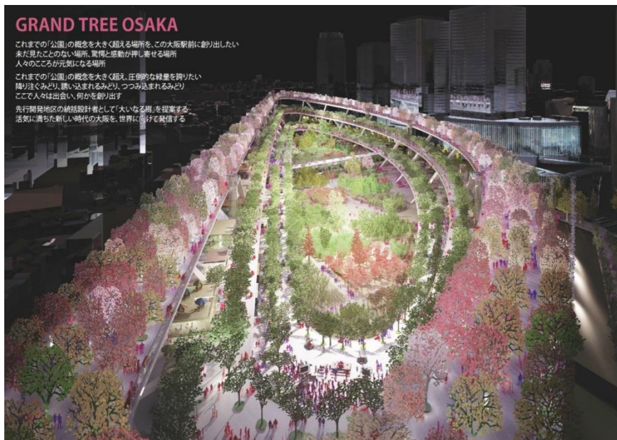
（南西方向からの眺望）