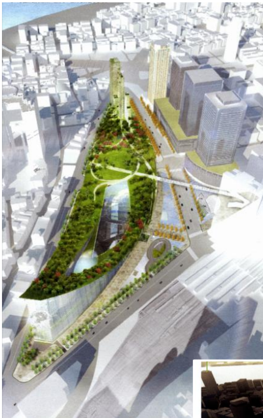
（南西方向からの眺望）