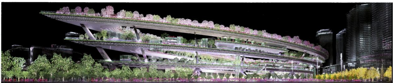
（JR 大阪駅方向からの眺望）