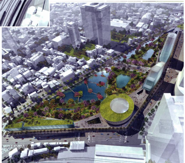
（JR 大阪駅方向からの眺望）