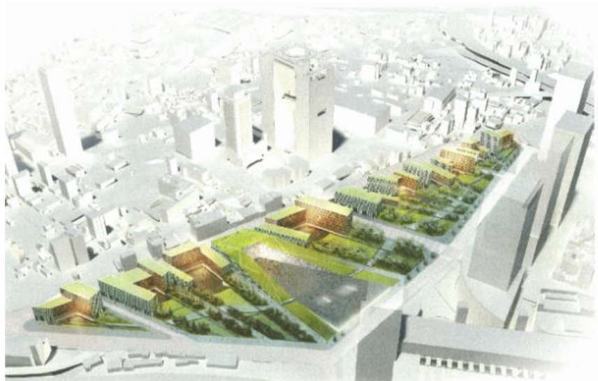
（JR 大阪駅方向からの眺望）