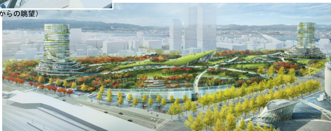
（JR 大阪駅方向からの眺望）