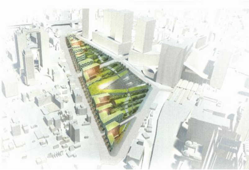
（南西方向からの眺望）