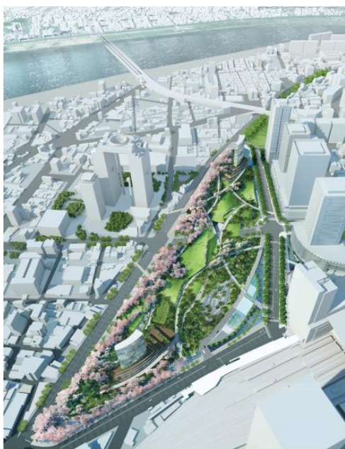
（南西方向からの眺望）