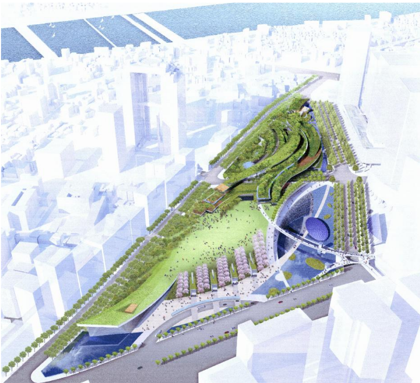
（南西方向からの眺望）