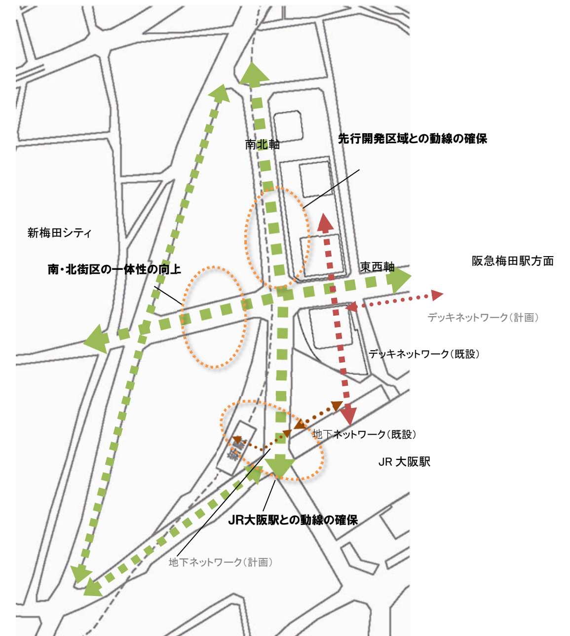
図 歩行者ネットワークの概念図