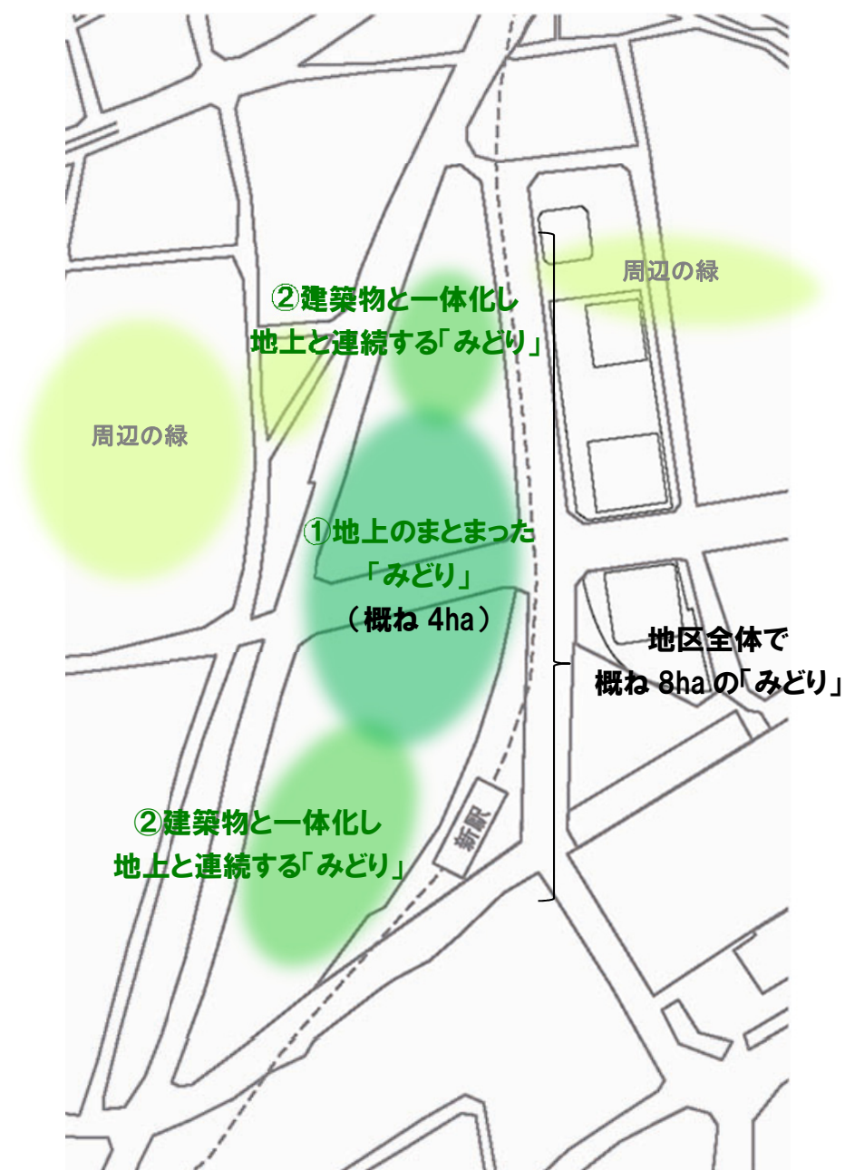
図 「みどり」の配置・規模