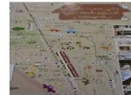
まちあるきマップ作成