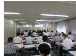
説明会開催 (8/2、50名参加)